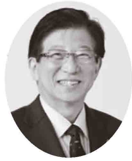
静岡県知事 川 勝 平 太

明けましておめでとうございます。 皆様、お健やかに新年を迎えられていることとお慶び申し上げます。