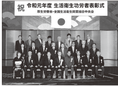
令和元年度 生活衛生功労者表彰式 会場: 厚生労働省 記者発表: 1月27日