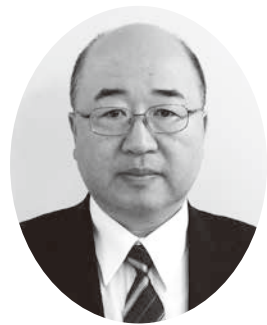
日本政策金融公庫静岡支店 国民生活事業統轄