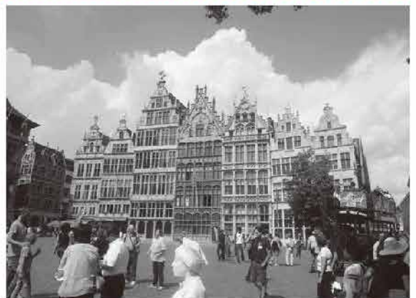
アントワープのギルドハウス

ギルドは各都市の政治・経済を支配しましたが、16世紀以後は生産力の高まりから資本主義的な生産が始まるとギルドは次第に衰退します。しかし、都市経済と全ヨーロッパ的な商業活動を発展させる原動力になりました。その名残りの「ギルドハウス」をヨーロッパの各都市で、当時のままの姿で見ることが