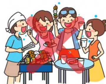
会話はマスク着用