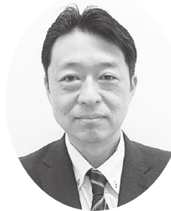
日本政策金融公庫 静岡支店 国民生活事業統轄