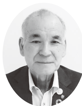
静岡県飲食業生活衛生同業組合