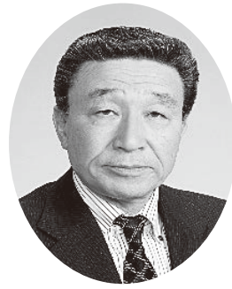
全国飲食業生活衛生同業 組合連合会 会長